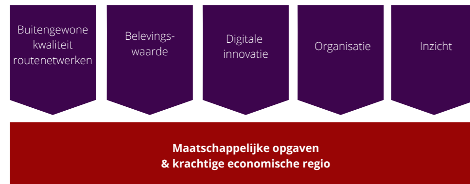
Figuur 2 — Pijlers routenetwerken Overijssel, uit 'Kwaliteitsinvestering routenetwerken Overijssel', november 2021

Routes zijn geen doel op zich, maar dragen bij aan belangrijke maatschappelijke opgaves en verhogen de economische en recreatieve waarde van de regio. De komende periode staat daarom ook in het teken van het behouden van onze kwaliteit, verhogen van de belevingswaarde, inspelen op innovaties, bereikbaarheid en veiligheid.