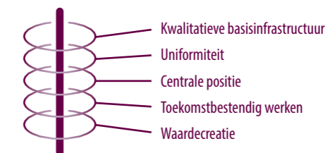
Figuur 3 — De een kan niet zonder de ander

De afgelopen jaren heeft de doorontwikkeling van de routenetwerken volop de aandacht gehad. Binnen de doorontwikkeling is ruimte gemaakt voor het toepassen van grote en kleine projecten en het inbedden van de (bestaande) routestructuren. Vanaf vaststelling van de visie is een extra risico, wanneer niet gewerkt wordt naar een toekomstbestendig model, dat nieuwe projecten alleen doorgang kunnen vinden als aan alle financiële en organisatorische voorwaarden wordt voldaan. Dit gaat ten koste van de filosofie en samenwerking, waarbij de te behalen hoofddoelen (3xG) ook onder druk komen te staan.