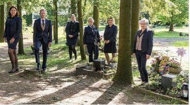
Medewerkers van het team ontferming.