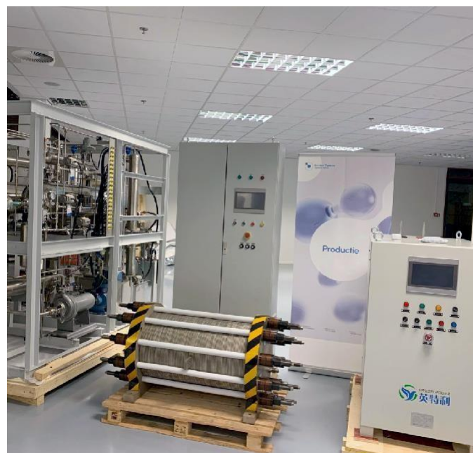
Opstelling van de elektrolyser bij de waterstofhub Twente.

hoge-temperatuur crematieproces op locatie Enschede opgezet. Bij de provincie Overijssel is hiervoor subsidie aangevraagd. Doel van deze haalbaarheidsstudie