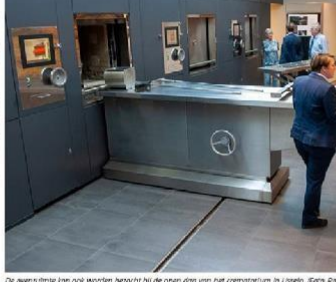
De open dag is ook worden bezocht bij de open dag van het crematorium in Usselo.