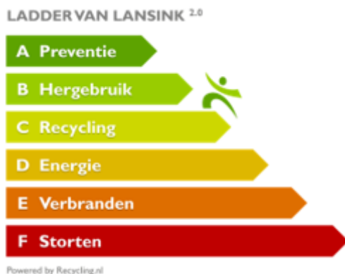
Figuur 2: De ladder van Lansink: hoe hoger op de R-ladder, hoe duurzamer

Het juridisch kader voor afvalbeheer wordt in hoge mate bepaald door Europese regels. Centraal daarin staat de Kaderrichtlijn Afvalstoffen. De richtlijn bevat het juridische kader voor de behandeling van afval in de EU. De richtlijn bepaalt dat bij het opstellen van wetgeving en beleidsinitiatieven voor de preventie en het beheer van afvalstoffen de volgende afvalhiërarchie als prioriteitsvolgorde moet worden gehanteerd: preventie, voorbereiding voor hergebruik, recycling, andere nuttige toepassingen (bijvoorbeeld energierecuperatie) en verwijdering.