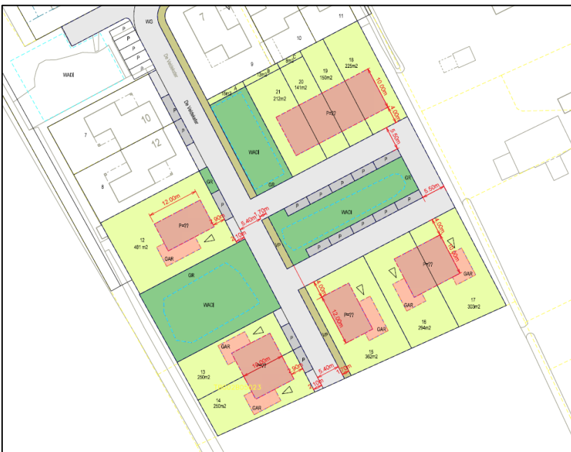
Figuur 2.7: Verbeelding van het wenselijk eindbeeld.

Het voornemen ziet toe het agrarisch land te gebruiken voor nieuwbouw. Figuur 2.7 weergeeft een impressie van de gewenste situatie.