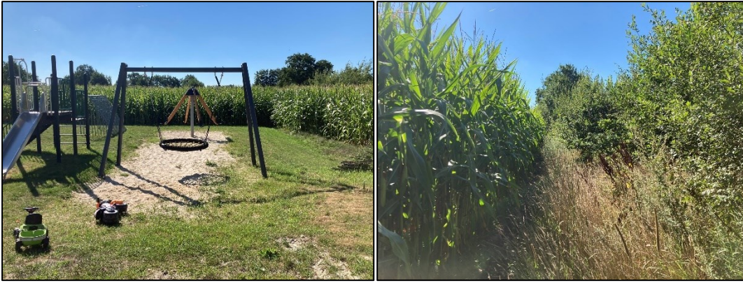
Figuur 2.3 (links): De speeltuin met daarachter het maïsveld; Figuur 2.4 (rechts): De zuidwestzijde van het maïsveld. Hier grenst het veld aan struiken en enkele (lage) bomen (eiken, populier). Direct achter de struikenrij, als begrenzing met het volgende agrarische perceel, ligt een greppel voor afwatering.