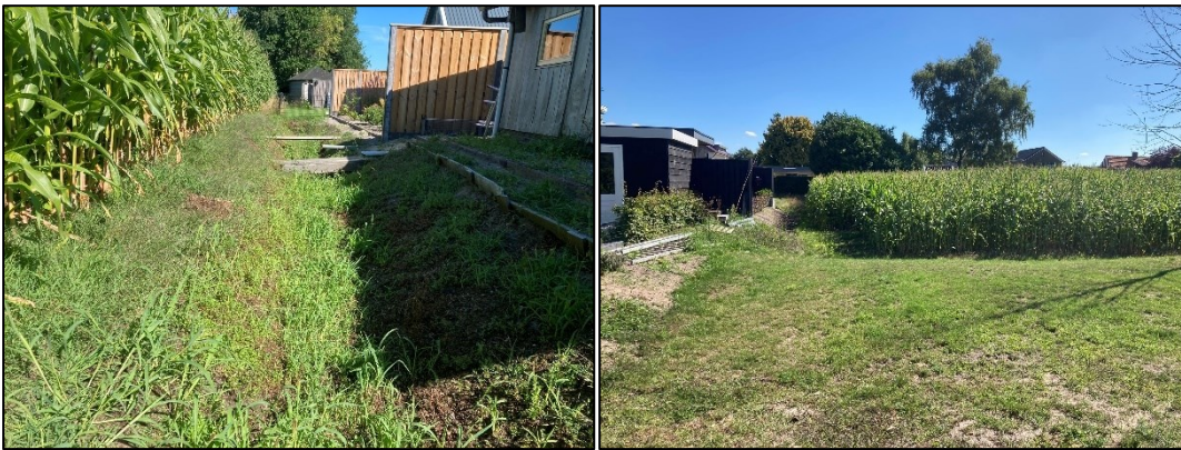
Figuur 2.5 (links): De begrenzing aan de noordoostzijde, hier grenst het perceel aan tuinen. Ook hier ligt een greppel voor afwatering; Figuur 2.6 (rechts): De noordzijde, waar het perceel grenst aan tuinen.