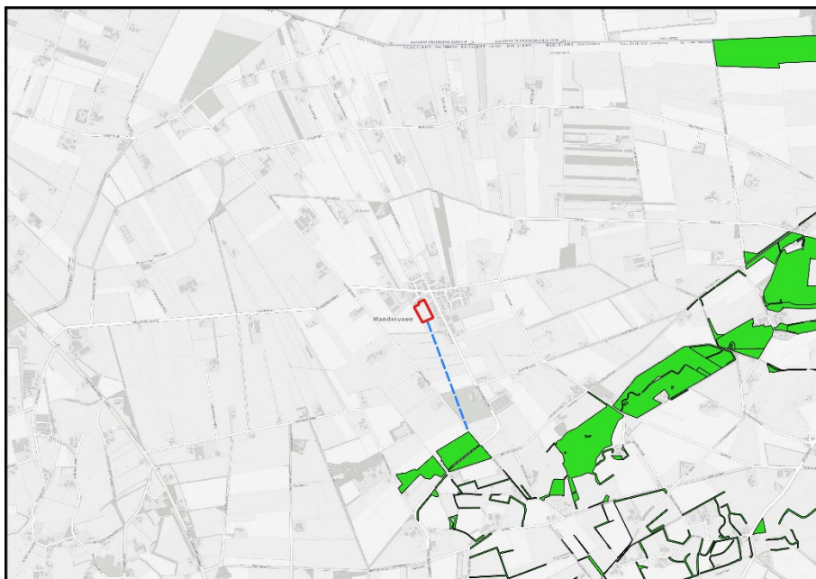
Figuur 5.2: Ligging van Natuurnetwerk Nederland in de omgeving van het plangebied (rode omlijning). Gronden die tot NNN behoren worden met de groene kleur op de kaart aangeduid. De minimale afstand tussen het plangebied en gronden die tot NNN behoren bedraagt 0,8 km.

Het plangebied ligt op minimaal 0,8 kilometer afstand van gronden die tot NNN behoren. Het plangebied ligt daarmee buiten de begrenzing van het NNN. In Figuur 5.2 wordt de ligging van het NNN in de omgeving van het plangebied weergegeven.