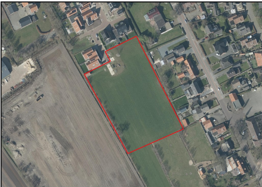
Figuur 2.2: Impressie van het plangebied (Bron: PDOK).

Het plangebied (Figuur 2.2) bestaat uit agrarisch land, met in het noorden een kleine speeltuin. Op moment van schrijven staat er maïs op het land.